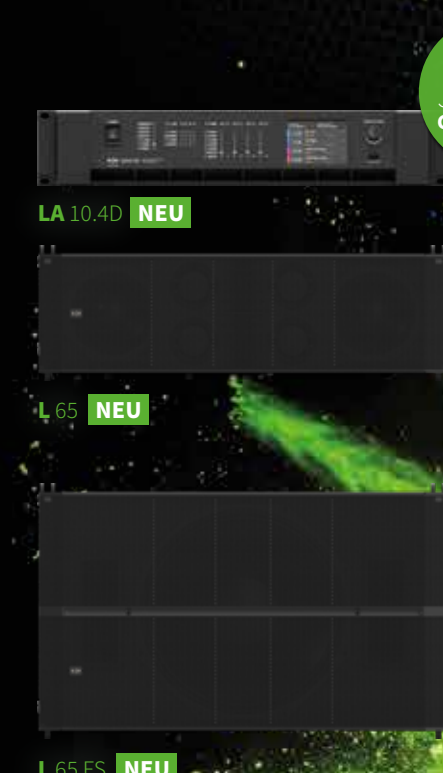
LA 10.4D NEU